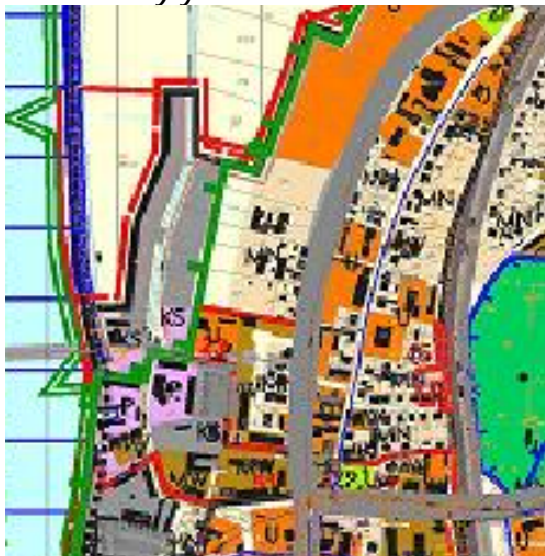
Wrys ze SUIKZ

Zgodnie z obowiązującym Studium uwarunkowań i kierunków zagospodarowania przestrzennego miasta i gminy Gryfino uchwalonym Uchwałą Nr XXI/183/08 Rady Miejskiej w Gryfinie z dnia 25 kwietnia 2013r. wraz z późniejszymi zmianami dla terenu wskazanego do zmiany mpzp przewidziana została funkcja: tereny zabudowy mieszkaniowej jednorodzinnej z towarzyszeniem usług, tereny rolnicze, tereny obiektów produkcyjnych oraz tereny drogi krajowej.