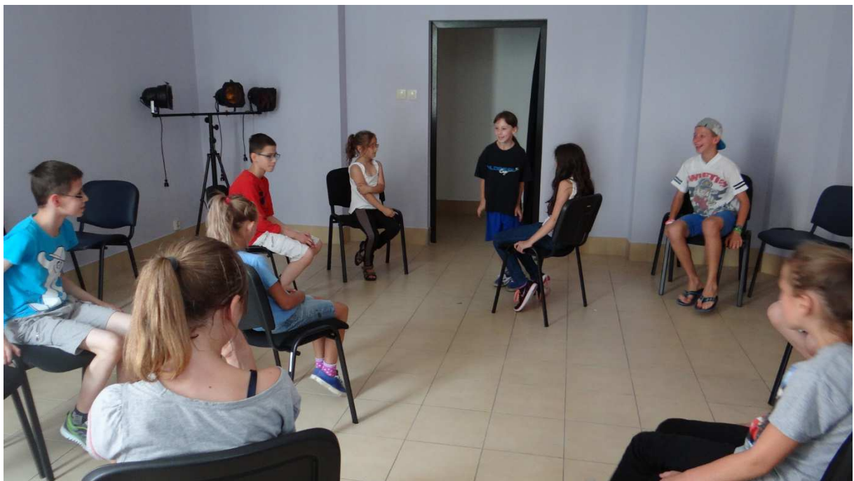
Zdj. Nr 7