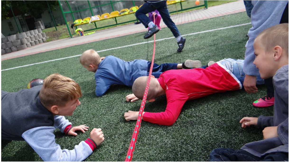
Zdj. Nr 10