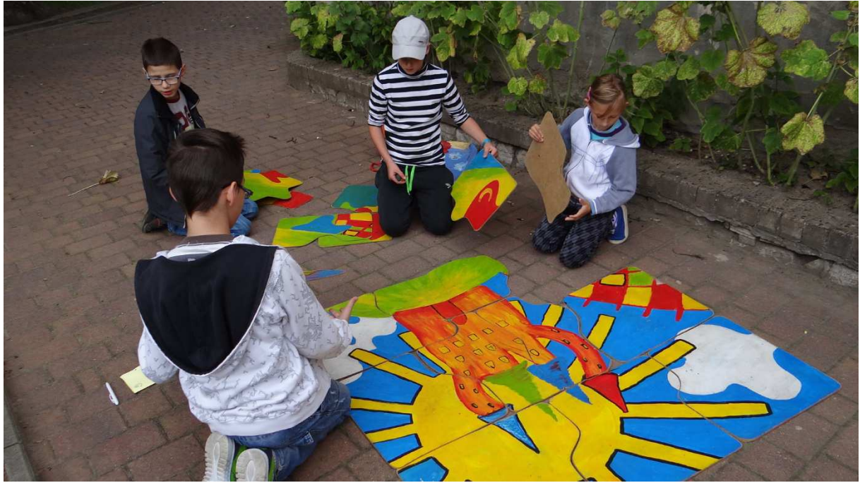
Zdj. Nr 2