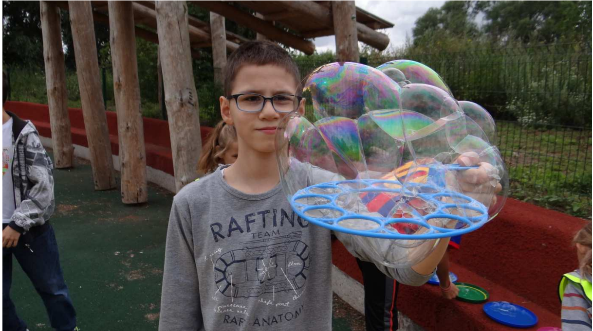
Zdj. Nr 6