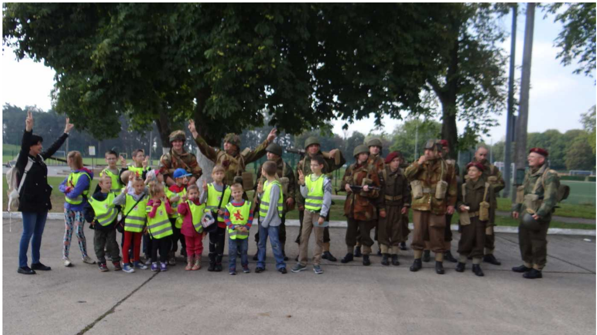
Zdj. Nr 3