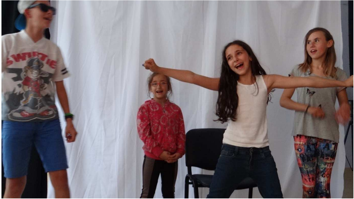
Zdj. Nr 8