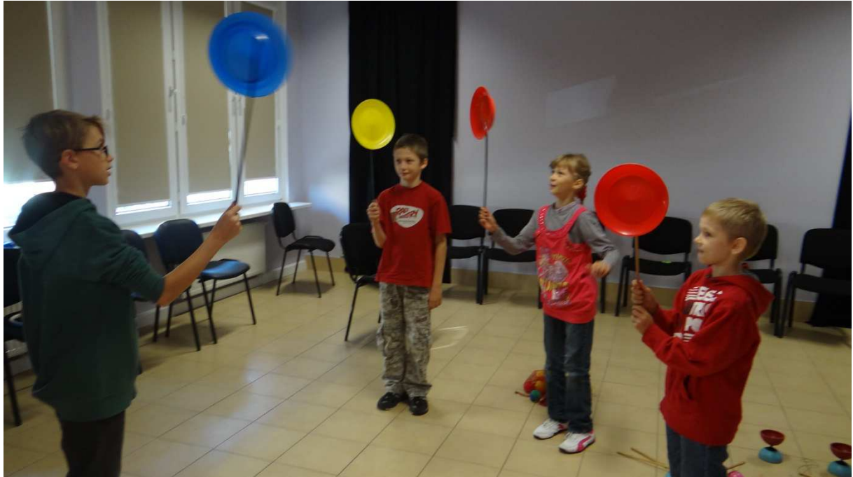
Zdj. Nr 4