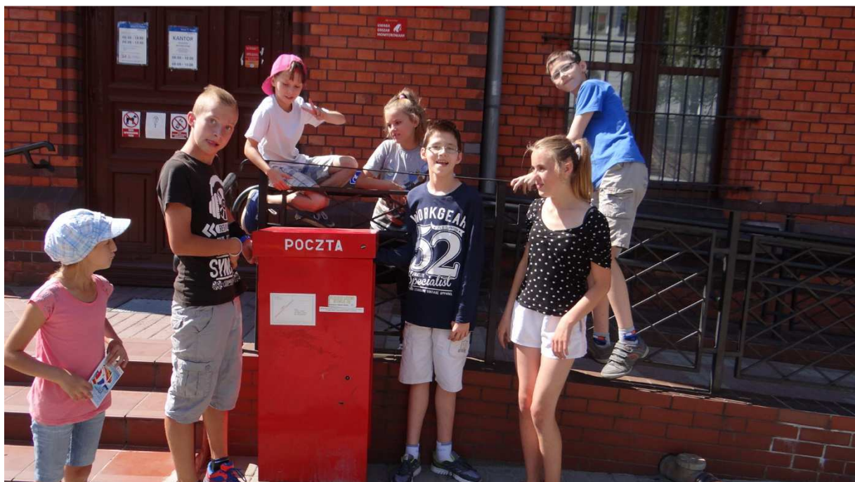
Zdj. Nr 1