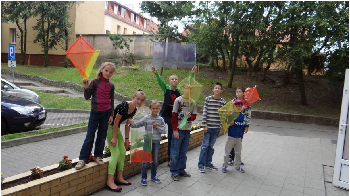
Zdj. Nr 9