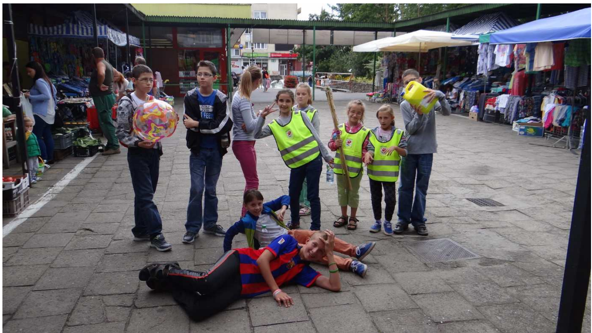
Zdj. Nr 5