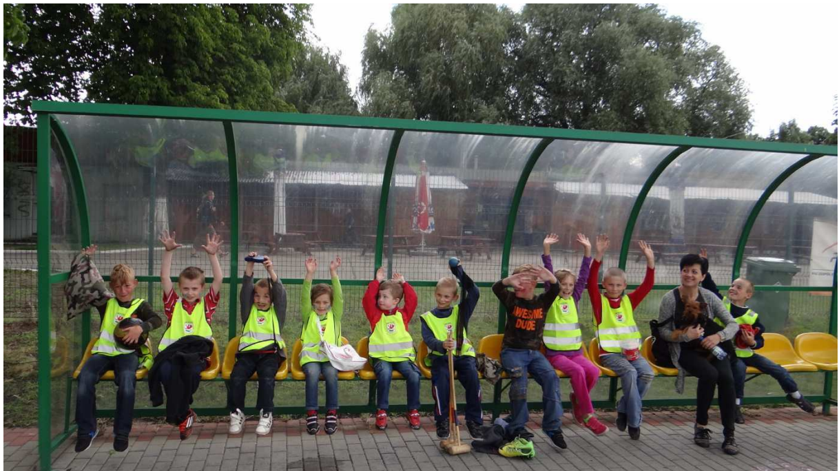
Zdj. Nr 11